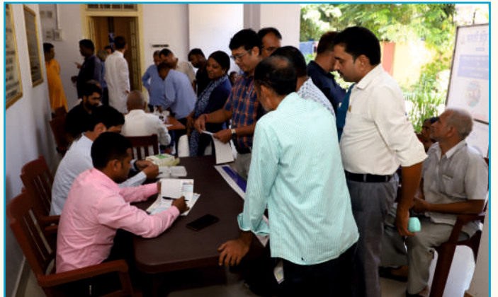
शिविर में ब्लड सुगर एवं बी.पी. की जाँच कराते लोग