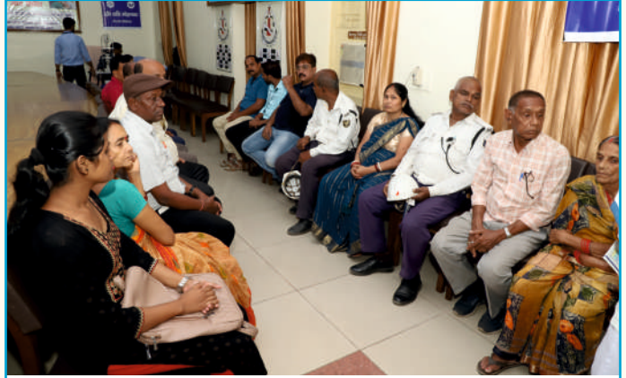
आँखों की जाँच हेतु अपनी बारी का इंतजार करते मरीज।