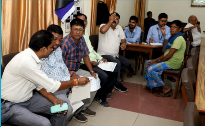
शिविर में आँखों के पावर की जाँच करते श्री बालाजी नेत्रालय के टेक्नीशियन।