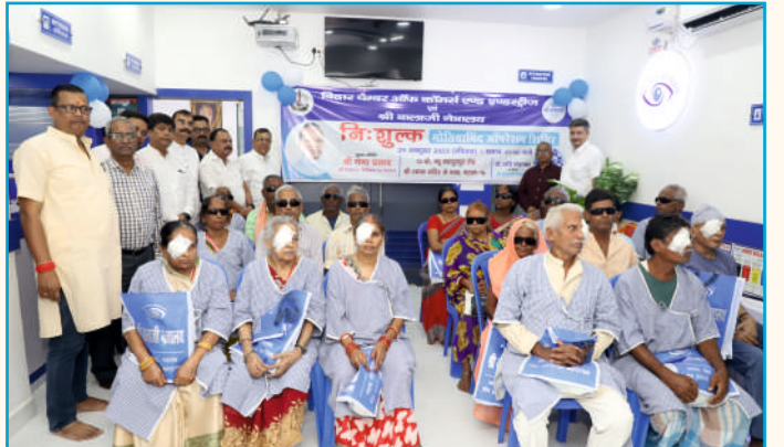
मोतियाबिन्द ऑपरेशन के पश्चात मरीजों के साथ उपस्थित चैम्बर के पदाधिकारीगण, पूर्व पदाधिकारीगण तथा कार्यकारिणी के सदस्यगण।